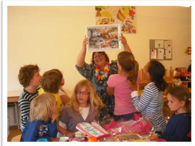
(de verjaardag van een pedagogisch medewerker)

Daar waar kinderen alleen mogen buiten spelen ondertekenen zij samen met de ouders en de leidster zelfstandigheid verklaring. Deze zijn onderdeel van ons veiligheidsbeleid.